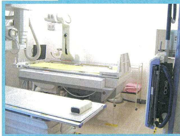
● デジタルX線撮影室